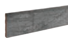
RODAPIÉ TU-0401112 310 x 86 x 11