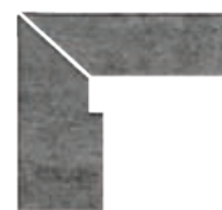
ZANQUÍN RECTO EVO CORTE TU-1521112 Drcho. TU-1521112 Izdo. 305 x 270 x 86