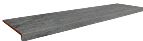
PELDAÑO RECTO EVO 1200 TU-5601112 1200 x 317 x 40