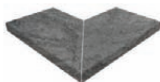
CARTABÓN EXTERIOR RECTO EVO TU-5701112 625 x 625 x 40