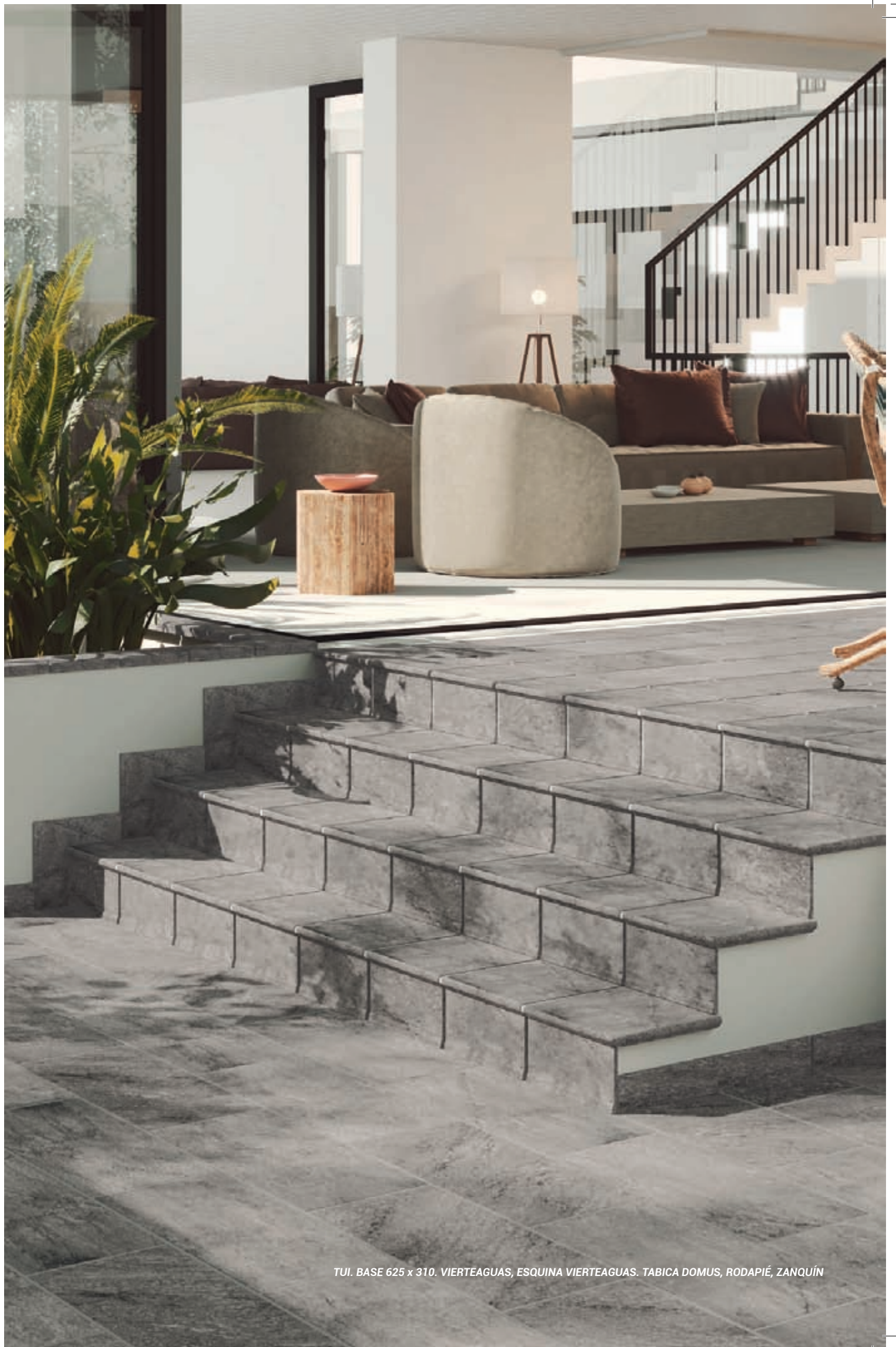
TUI. BASE 625 x 310. VIERTÉAGUAS, ESQUINA VIERTÉAGUAS. TABICA DOMUS, RODAPIÉ, ZANQUÍN