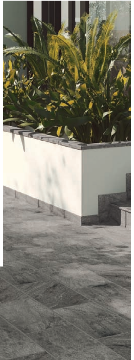
TUI. BASE 310 x 310. PELDAÑO VIERTEAGUAS, ESQUINA VIERTEAGUAS. TABICA DOMUS, ZANQUÍN, RODAPIÉ Y PASAMANOS.