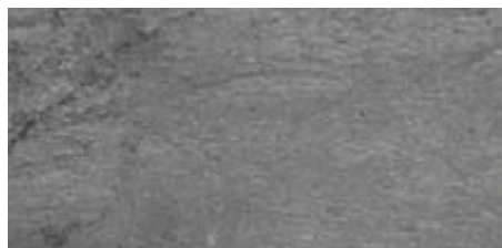
BASE TU-5501111 625 x 310 x 10