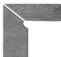
ZANQUÍN VIERTEAGUAS CORTE TU-1911112 Drcho. TU-1921112 Izdo. 310 x 270 x 86