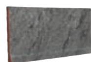
TABICA DOMUS TU-0871112 310 x 150 x 20